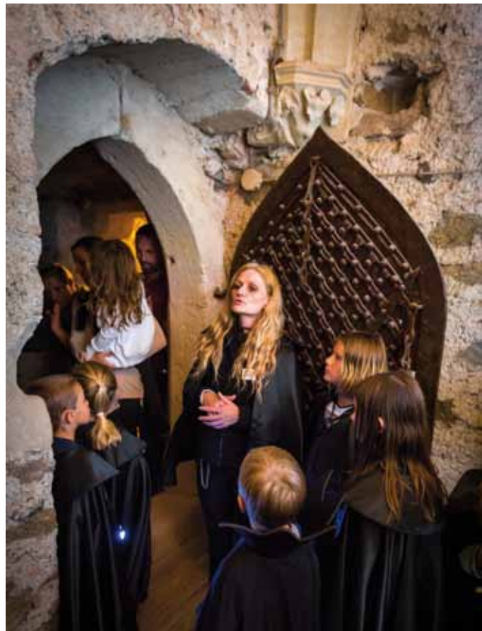
■ Draculade – Mondscheinführung auf Burg Forchtenstein

► Giftfrei: Bei Reinigungsarbeiten werden ausschließlich um-