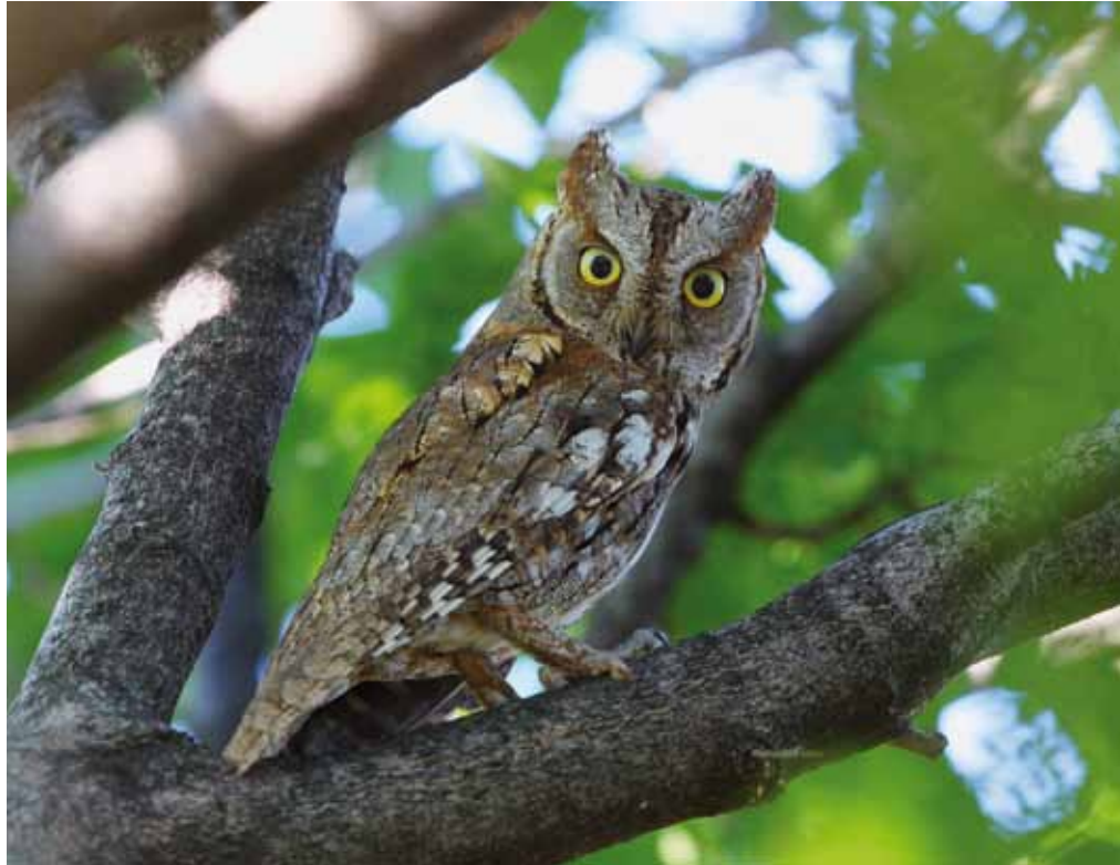
■ Das Artenschutzprogramm für die Zwergohreule im Mattersburger Hügelland gibt Aufschluss über die Lebensweise dieser geschützten Art.

Ein Ungleichgewicht in unseren heimischen Ökosystemen kann durch nicht autochthone Arten entstehen, die ungewollt