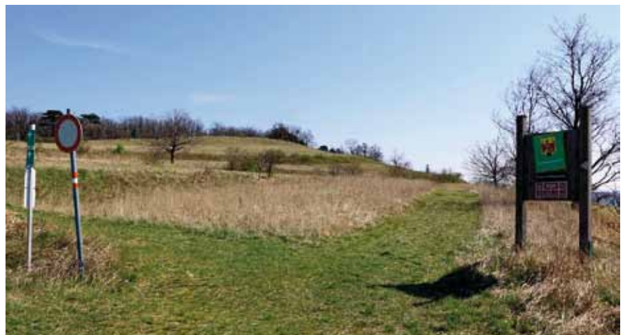
■ links und oben: Seit 55 Jahren kümmern sich Naturschutzorgane um die burgenländischen Schutzgebiete unterschiedlichster Kategorisierungen.