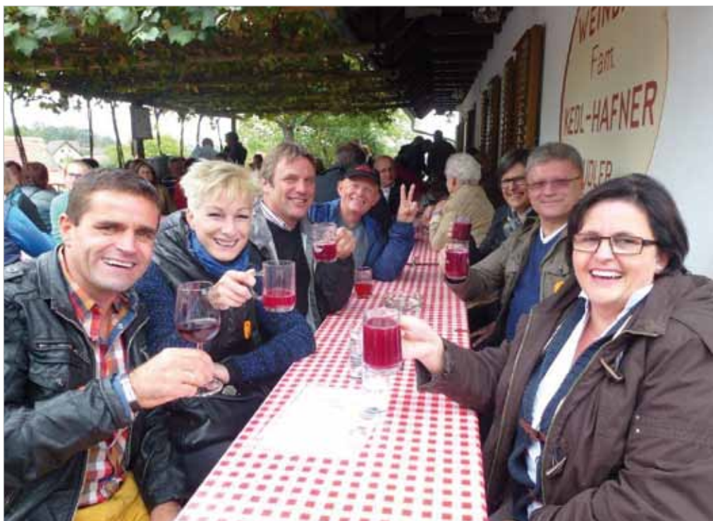
■ Jedes Jahr auf's Neue ein genussvolles Erlebnis: Das Uhudlersturmfest in Heiligenbrunn

Einmal mehr bot die Kellergasse in Heiligenbrunn mit ihren historischen, zum Teil strohgedeckten Weinkellern einen einzigartigen Festplatz für das traditionelle Uhudlersturmfest am 24. September. Kurz nach der Lese stand der Uhudlersturm im Mittelpunkt der gelungenen Veranstaltung. Daneben konnten aber auch Uhudler, Uhudler-Frizzante und vieles mehr probiert und degustiert werden. Dazu gab es kulinarische Köstlichkeiten, die die Winzer zu Sturm und Wein reichten.