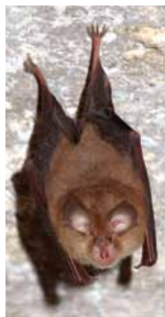
■ Die Kleine Hufeisennase fühlt sich auf Burg Forchtenstein wohl.

Neben direkten Fressfeinden, wie Katzen und Mardern, sind